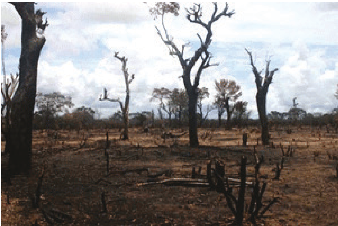
රූපය 1.1 නවදලිහේන

එවැනි හේන් ඉතා සරුසාර කෘෂි බිම් ලෙස සැලකේ.