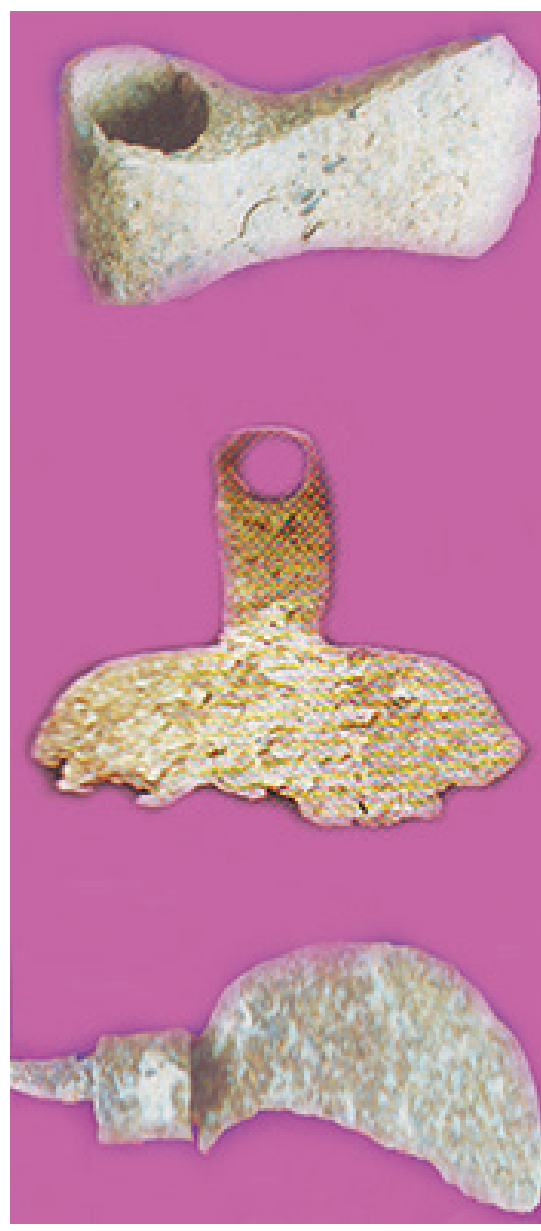
රූපය 1.2 පැරණි යුගයේ භාවිත කළ කෘෂි උපකරණ කිහිපයක්

හේන් වගා කටයුතු සඳහා කැති, උදලු, දෑ කැති වැනි සරල උපකරණ භාවිත කර ඇත.