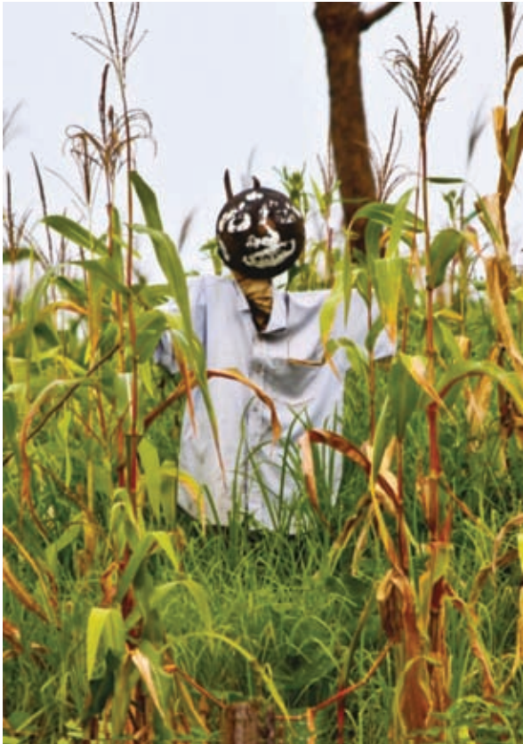
රූපය 1.3 පඬයා